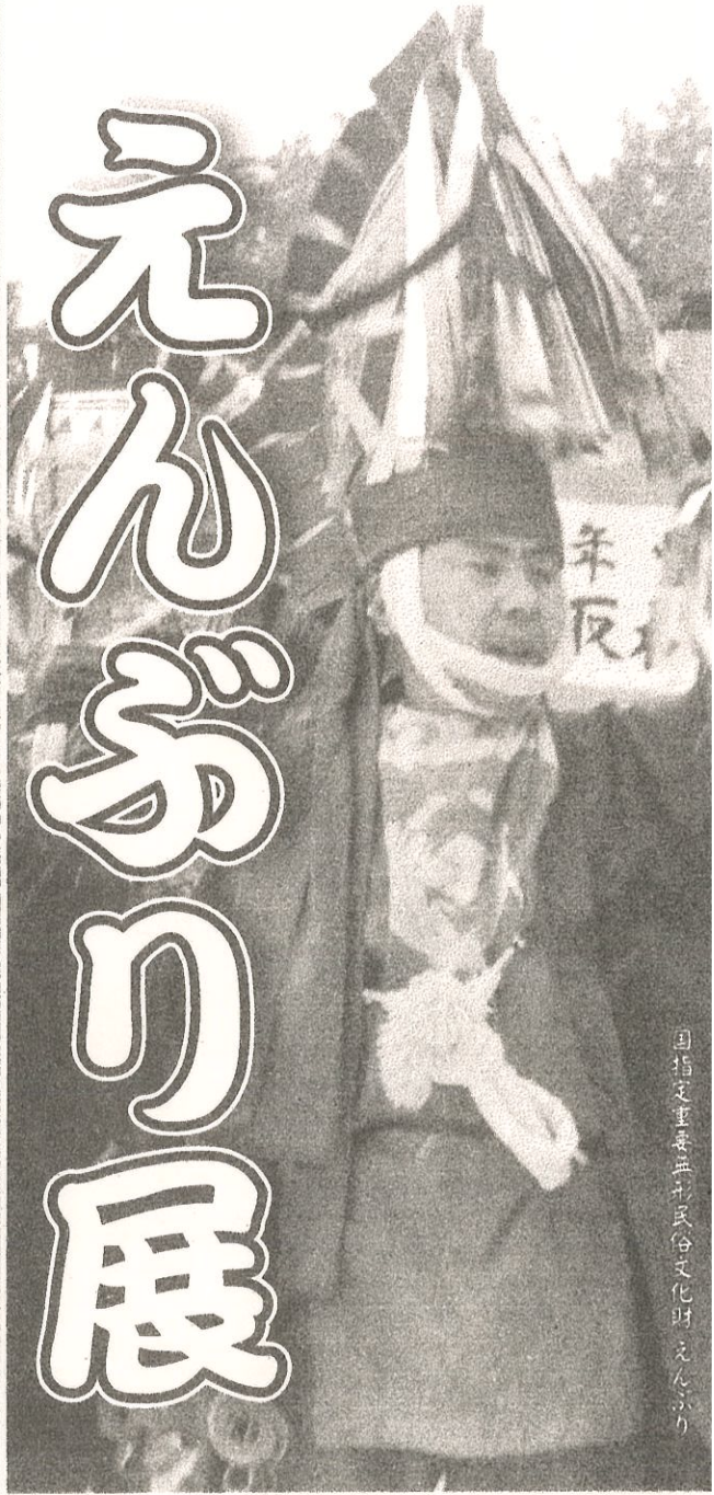
国指定重要無形民俗文化財 えんぶり