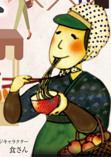
イメージキャラクター 食さん